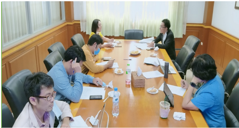
การประชุมร่วมกับผู้นำชุมชน