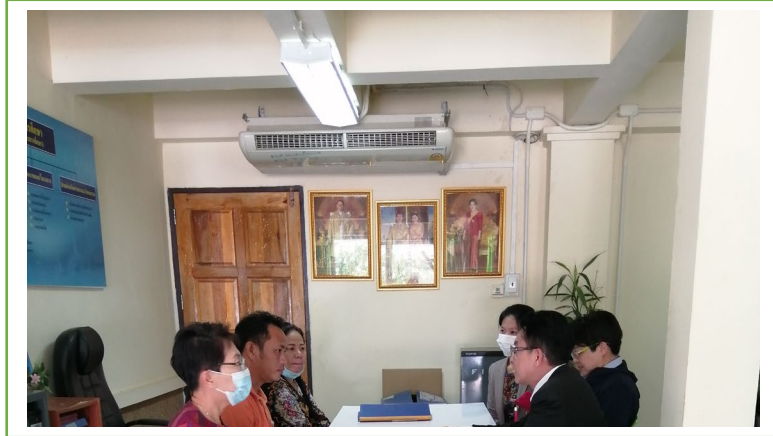
การลงพื้นที่เพื่อเก็บข้อมูล